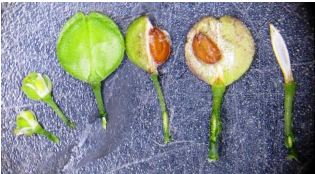
En dank zei Luc zijn huiswerk kan je nu ook de zaadjes bewonderen