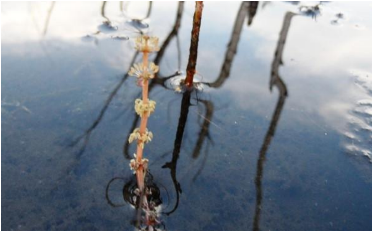
Een van de specialekes is zeker dit aarvederkruid