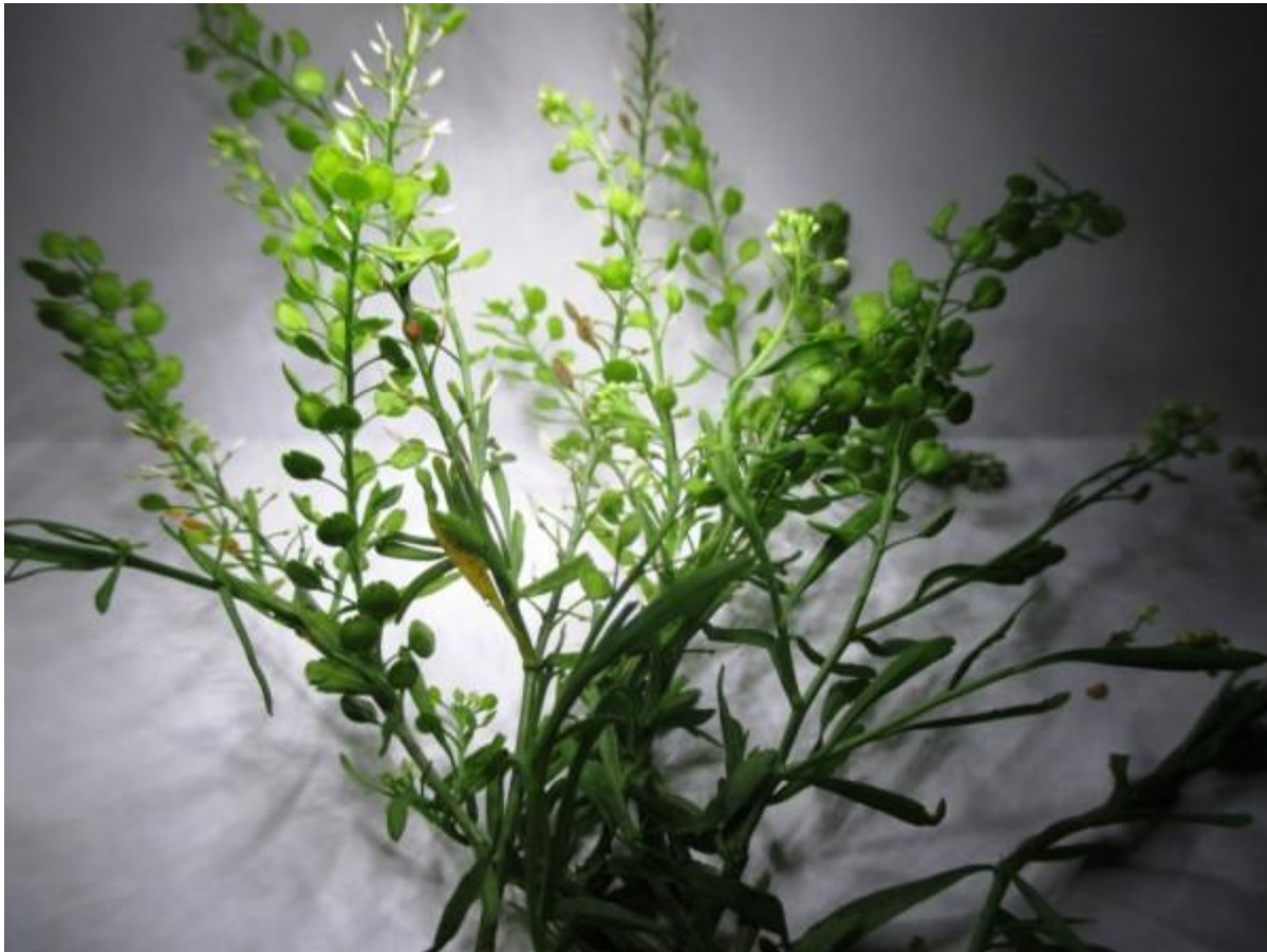
Dit is Amerikaanse kruidkern