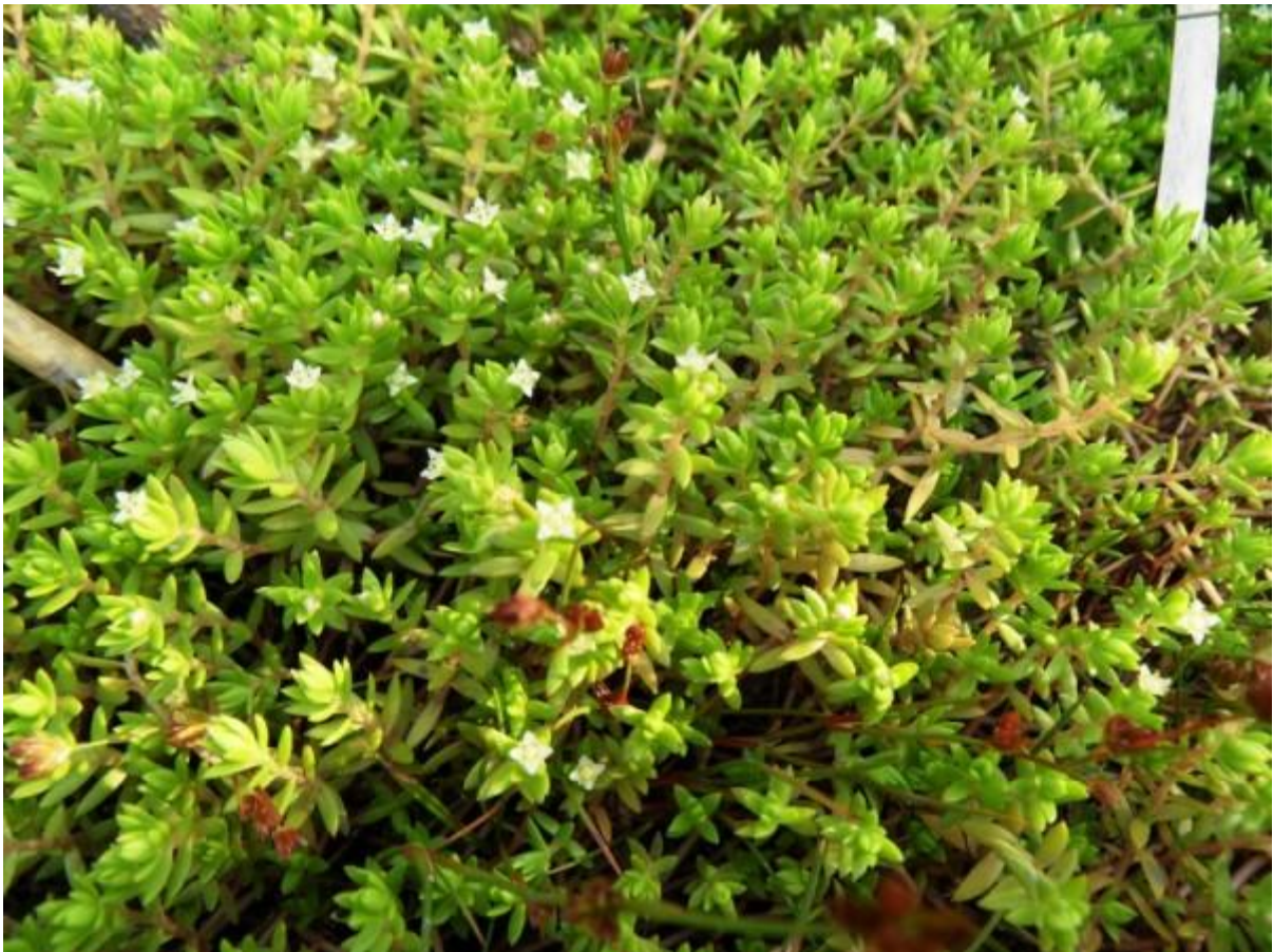
Dat kan je van deze watercrassula moeilijk zeggen